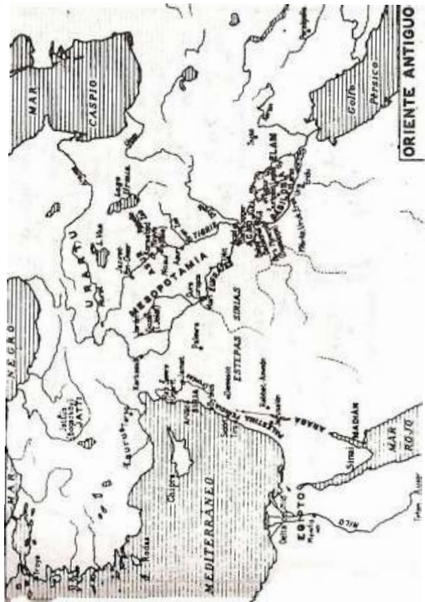
Mapa del Próximo oriente 1500 a. C. 67.